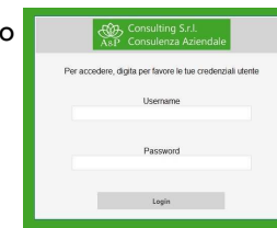
Maschera di Login di A&P Manager

te all'utilizzatore di A&P Manager di essere avvisato, per esempio, del superamento del tempo concesso per l'aggiornamento del registro, oppure del superamento dei limiti imposti per il deposito temporaneo presso l'impianto di produzione dei rifiuti.